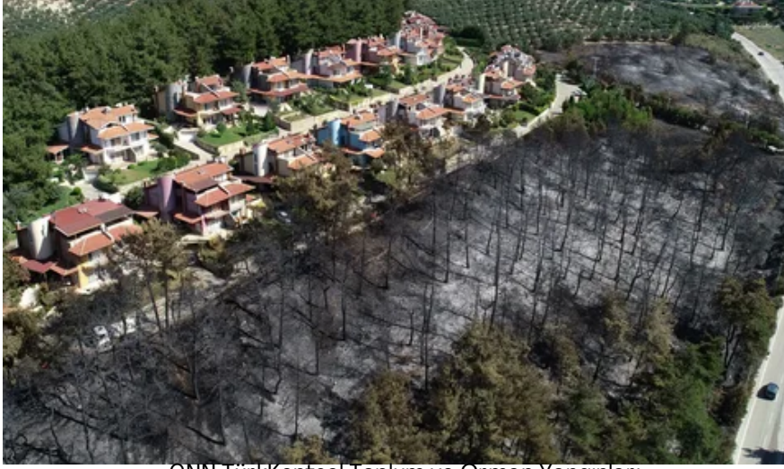
CNN TürkKentsel Toplum ve Orman Yangınları

Ayrıca; Türkiye'nin kırsal yerleşim alanlarındaki nüfusu orman yangınları açısından hassas olan yaz mevsiminde 30 milyonun üzerine çıkmaktadır. Orman Yangınları açısından yüksek risk grubunda olan Akdeniz bölgesindeki kırsal yerleşimlerin ortalama nüfusu kışın 933 iken yazın 1.703'e çıkmaktadır. Bu rakamlar Ege'de 735 ve 1.234, Marmara'da ise 685 ve 1.153'tür (Sanayi ve Teknoloji Bakanlığı, 2020). Yaz aylarını, genellikle kendilerini ait hissettikleri kırsal alanlarda geçirmek isteyenlerin o bölgelerdeki ormanlarla ilişkisi ise daha çok rekreasyonel amaçlı olmakta, ateşli piknik önemli bir tehdit oluşturmaktadır